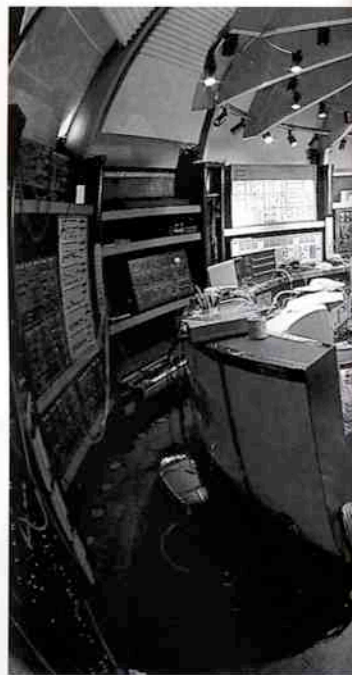
Tot in het laatste hoekje gevuld

Het binnenkort te verschijnen Erasure album is niet alleen een combinatie van drie muzikale geesten, het is ook een